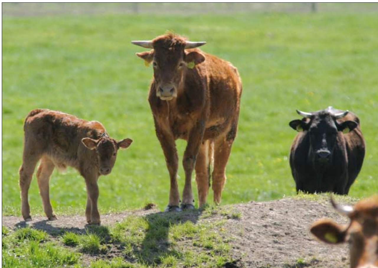
Wypas zwierząt jest jednym z czynników pomagających utrzymać bioróżnorodność

zane były z prowadzoną działalnością (np. grunty będące pod zabudowaniami, pod drogami, torfowiska, zwirownie). Średnia powierzchnia gruntów w jednym gospodarstwie rolnym w 2005 r. wynosiła 6,71 ha (dla gospodarstw indywidualnych 5,86 ha), w tym użytków rolnych – 5,82 ha (dla gospodarstw indywidualnych – 5,13 ha). Natomiast średnia powierzchnia gruntów w gospodarstwach o powierzchni powyżej 1 ha UR ogółem wynosiła 9,93 ha (dla gospodarstw indywidualnych – 8,63 ha), użytków rolnych – 8,69 ha (dla gospodarstw indywidualnych – 7,65 ha) (GUS, 2006). Biorąc pod uwagę gospodarstwa rolne, które prowadzą działalność rolniczą, średnia powierzchnia użytków rolnych w tych gospodarstwach w 2005 r. wynosiła 6,19