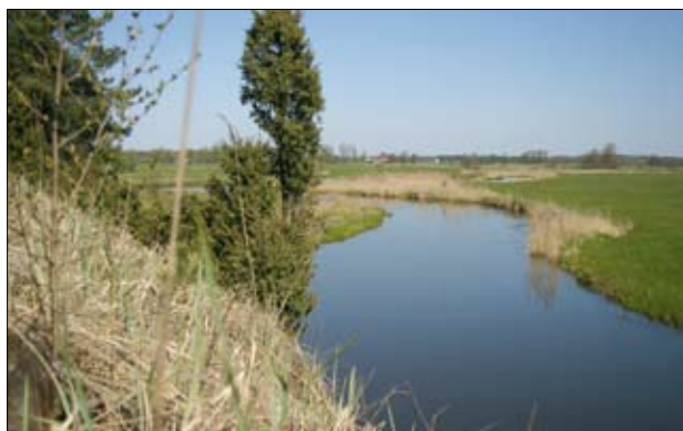
Dolina rzeki Omulwi