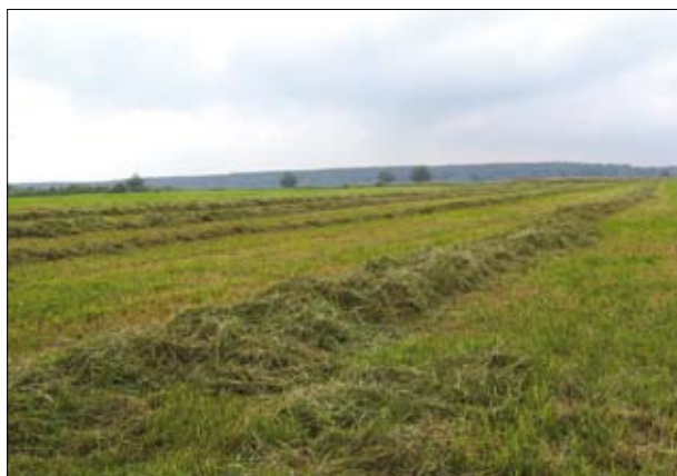
Skoszone łąki