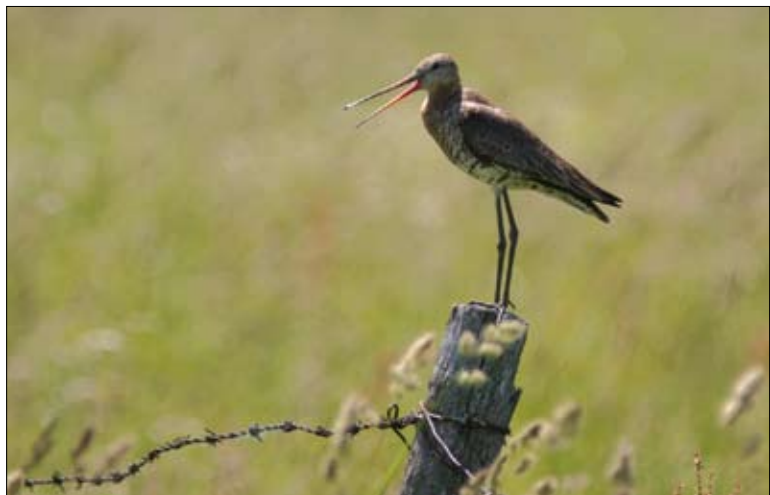
Rycyk – gatunek kwalifikujący