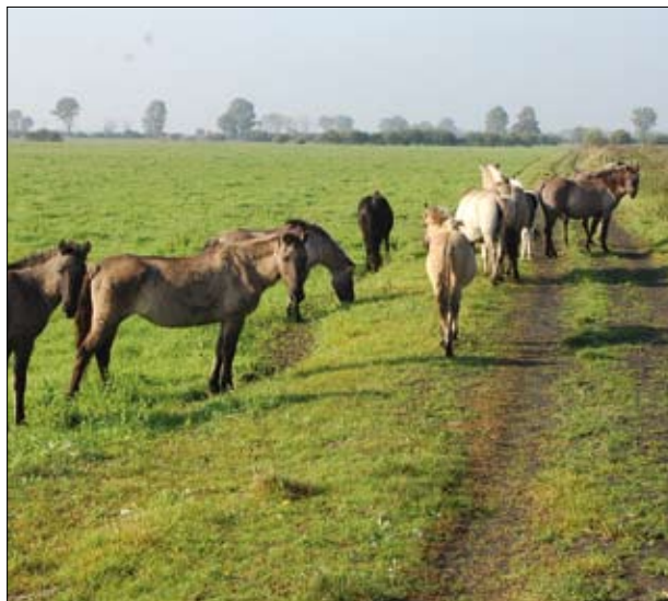
Koniki polskie w parku narodowym „Ujście Warty”

W ostatnich latach przedstawia się ona w sposób następujący: 2005 r. – 4, 2006 r. – 5, 2007 r. – 8, 2008 r. – 7 śpiewających samców. Użytkowanie kośne jest ściśle uzależnione od czasu trwania okresu lęgowego. Odbywa się zwykle nie wcześniej niż na początku sierpnia. Od roku 2005 na opisywanym terenie realizowany jest pakiet P01a02 Półnaturalne łąki jednokośne programu rolnośrodowiskowego 2004–2006. Równocześnie obszar ten został zgłoszony do jednostki certyfikującej jako gospodarstwo ekologiczne. Dla omawianego gospodarstwa program rolnośrodowiskowy w ramach PROW 2007–2013 daje możliwość sporządzenia nowego planu rolnośrodowiskowego w ramach wariantu 5.1 Ochrona siedlisk lęgowych ptaków w 2010 roku.