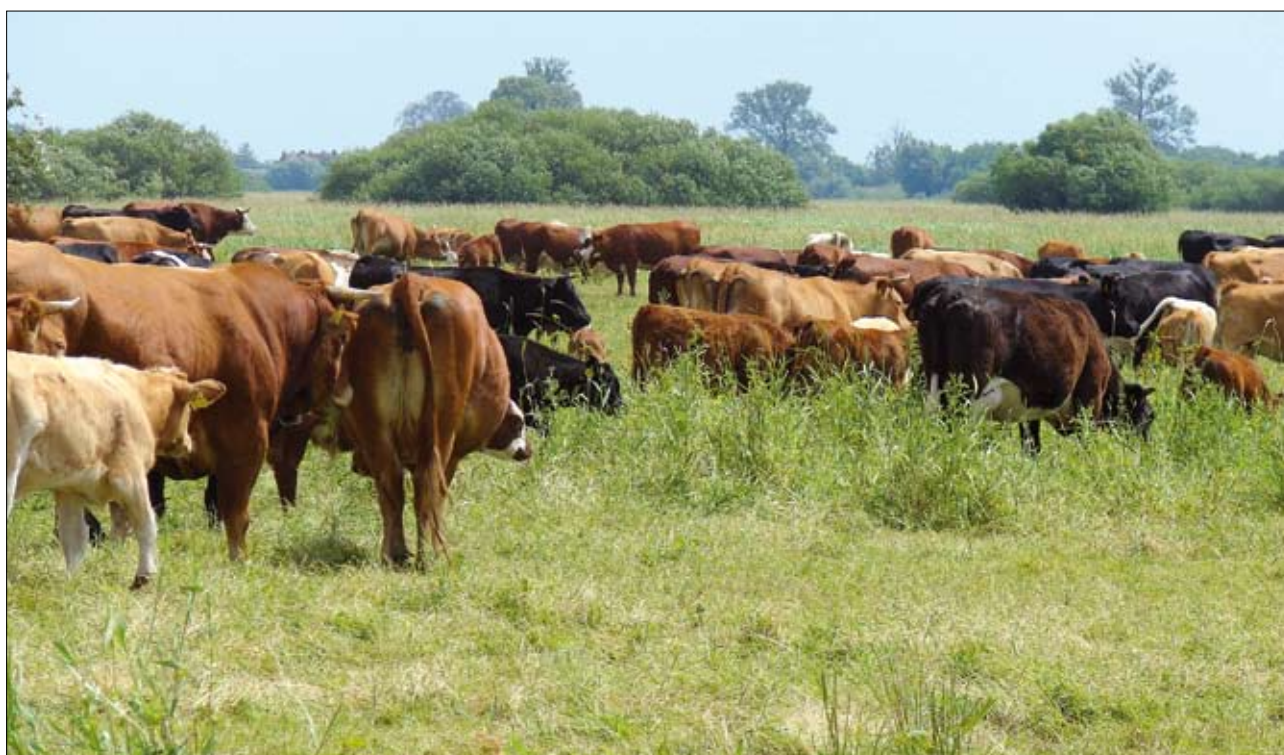
Bydło ras mięsnych wypasane na terenie parku narodowego „Ujście Warty”

rząt na naturalnym pastwisku. Dominującą rasą jest rasa Limou-sine. Stado liczy teraz około 2000 sztuk. Kierunek przyszłościowy to specjalizacja w chowie czystorasowym bydła mięsnego tej rasy. Stado maceczne pochodzi z najlepszych hodowli francuskich, niemieckich i holenderskich. Stamtąd pochodzą również rozplodniki, które są używane do krycia naturalnego. Stado jest pod oceną hodowlaną Polskiego Związku Hodowców i Producentów Bydła Mięsnego. Materiał hodowlany z tego gospodarstwa jest wpisywany do ksiąg hodowlanych prowadzonych przez Związek. Wysoką wartość hodowlaną bydła rasy Limousine potwierdzają liczne puchary i dyplomy zdobywane przez zwierzęta z tego gospodarstwa na regionalnych rolniczych wystawach i w konkursach hodowlanych. W produkcji bydła mięsnego stosowane są tu naturalne metody chowu. Są one oparte na przyjaznych zwierzętom i ekologicznych, nadodrzańskich i nad-