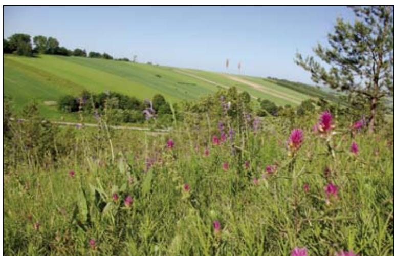
Murawa kserotermiczna

terenie tego konkretnego województwa. Po odczytaniu nazw obszarów możemy dokonać wstępnej klasyfikacji położenia danego obszaru. Jeżeli w tym miejscu rolnik zorientuje się, że jego gospodarstwo może znajdować się na terenie konkretnego obszaru, powinien przejść do załączonych z prawej strony map, z których przynajmniej wstępnie da się odczytać granice i potwierdzić lub wykluczyć położenie gospodarstwa na obszarze Natura 2000. Strona Ministerstwa Środowiska jest dotychczas jedynym miejscem, gdzie można znaleźć mapy z granicami obszarów Natura 2000. Co prawda mapy te nie są na tyle dokładne, by odnaleźć na nich konkretną działkę rolną, ale z pewnością pozwalają się dość dobrze zorientować w położeniu.