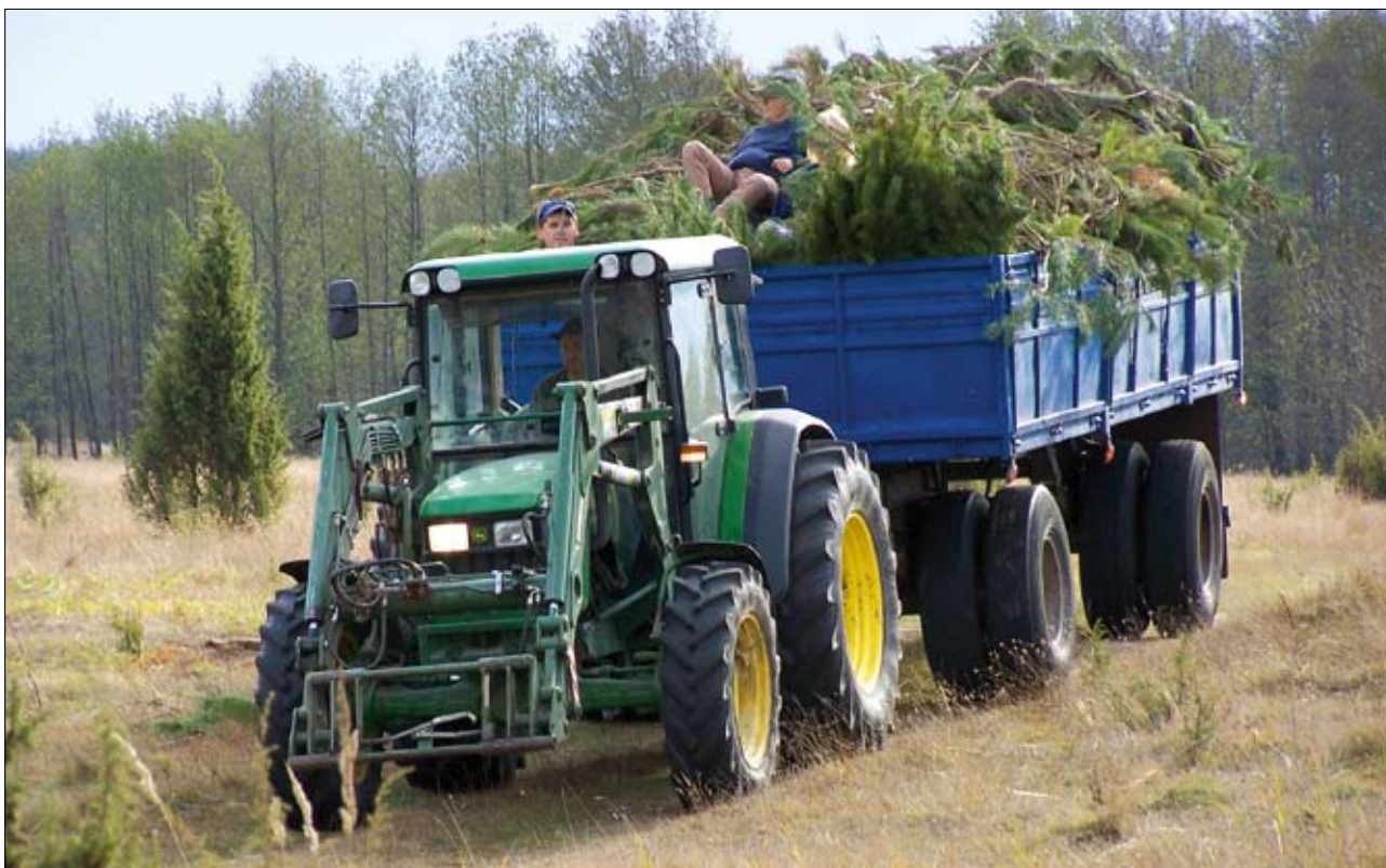
Usuwanie samosiewów sosny pomaga w zachowaniu otwartego krajobrazu